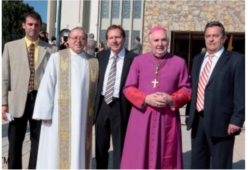
Empfang des Bischofes seitens der Pfarrgemeinde und der Marktgemeinde

Um 8.30 Uhr wurde der Bischof vor der Pfarrkirche herzlich empfangen und in die Kirche geleitet. Danach erfolgte die Eucharistiefeier und Spende des Firm sakramentes. Um 11.00 Uhr besuchte Bischof Iby den Gemeinderat im Rathaus und danach fand ein Gespräch mit dem Pfarrgemeinderat im Pfarrheim statt. Das Mittagessen wurde im Gasthaus Schweiger eingenommen. Am Nachmittag segnete der Bischof die neue Angerkapelle.